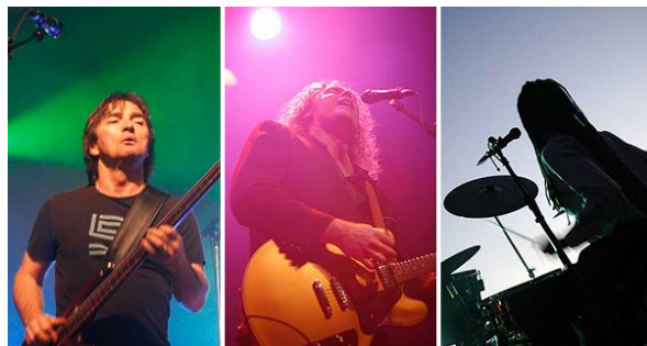
The High Rollers