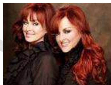
Naomi et Wyonna Judd